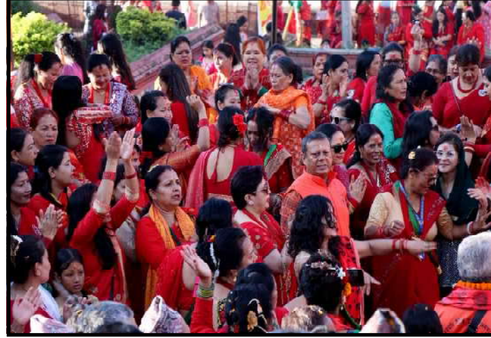
हिँडन थालेको पन्ध्र दिन भयो ।

सावित्रीका घरमा वृद्ध र रोगी सासु-ससुरा बुहारीको पर्खाइमा दिन बिताउन थालेको साता दिन भइसकेको छ । अरुबेला विशुद्ध गृहिणी बनेर सेवा गर्दै आइरहेकी बुहारी भदौ लागेसँगै तिजका दर खान