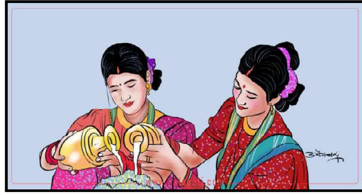
हजुरबा हजुरआमालाई जति पीर कसलाई परेको होला र ? आमा गहना जुटाउने योजनाको भासबाट उत्रिनै सकेकी छैन ।

सुनमाया दिनदिनै नयाँ-नयाँ गहना किनिदिन आग्रह गर्दै श्रीमानसँग ऋगडा गरिरहन्छे । उसलाई हरेक दिनको कार्यक्रममा नयाँ गहना किन चाहियो भन्दै छोरीहरू कराउँछन् । उसले थाहा नपाउने गरेर आमाको सुनप्रतिको क्रेजको भिडियो बनाएर सामाजिक सञ्जालमा हाल्किण्ड्छन् । ऊ भाइरल बनी तर रिसले छोरीहरूमाथि जाइलाग्दा दुवै छोरी हावाकावा । मामाघर गएका छोरीहरू तिज नसकिएसम्म आमाबाको ऋगडाका साक्षी बन्न घर नफर्कने भनेका छन् रे । पढाइ बिचोकामा